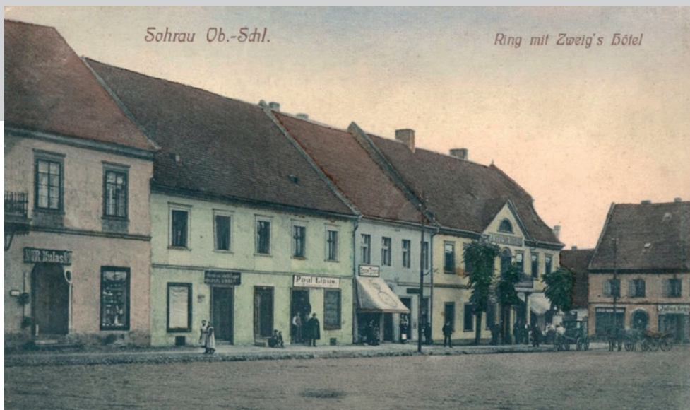
Zweig's Hotel w zabudowie rynku w Żorach, 1919 r.

„4 lipca 1922 roku miasto Żory zostało po ponad sześciu wiekach przejęte przez administrację polską. Uaktywniło się życie wielu organizacji polskich, takich jak Towarzystwo Śpiewacze »Feniks«, Towarzystwo Gimnastyczne »Sokół«, organizacja ZHP, Związek Matek Polek itp., powstałych jeszcze w czasie zaboru pruskiego, spełniających wtedy rolę budzicieli polskości. W 1922 roku powołano do życia Państwowe Gimnazjum im. Karola Miarki, Sąd Powiatowy oraz powstał nowy zakład wytwórczy »Minerwa«, w którym w późniejszym okresie produkowano łożyska. W okresie międzywojennym miasto rozwijało się w różnych kierunkach. W związku z rozwojem motoryzacji zbudowano stację benzynową. Finansową obsługą mieszkańców zajmowały się Bank Ludowy i Komunalna Kasa Oszczędności. Nowa poczta świadczyła usługi telefoniczne i telegraficzne. Istniał szpital miejski. Wybudowano nowe boiska sportowe i duży budynek »Sokolni«. Wzniesiono również nową świątynię kościoła ewangelickiego. W mieście ukazywały się dwie gazety: polska »Gazeta Żorska« i niemieckojęzyczna »Sohrauer Stadtblatt«. W 1937 roku oddano do użytku nowy gmach gimnazjum, a w 1938 roku Ogród Jordanowski. Na Kleszczówce uruchomiono Spółdzielnię Mleczarską. Ważną rolę odegrało połączenie kolejowe Rybnik–Żory, otwarte w 1936 roku, przedłużone po dwu latach do Pszczyny. Wcześniej, bo już w 1925 roku, uruchomiono komunikację autobusową z Rybnikiem”.