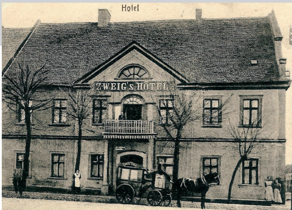
Gruß aus Sohrau O.-S. Zweig's Hotel - Telefon 15