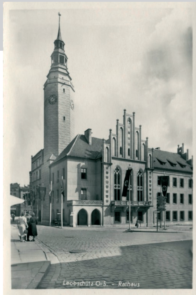
Ratusz w Głubczycach po przebudowie wykonanej w 1936 r. Na rynku widoczne flagi nazistowskie ze swastyką (po 1936 r.)