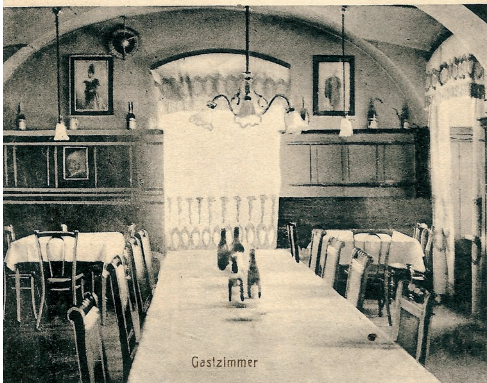
Zweig's Hotel i jego wnętrze na pocztówce z Żor, przed 1914 r. (MŻo/1351)